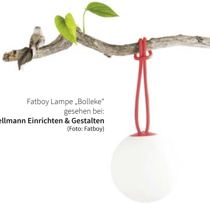
Fatboy Lampe „Bolleke“ gesehen bei: Tellmann Einrichten & Gestalten