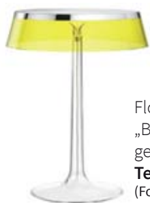
Flos Tischeuchte „Bonjour“ gesehen bei: Tellmann Einrichten & Gestalten

...da blüh' ich auf! Vorfreude ist die schönste Freude Entdecken Sie unseren Weihnachtsmarkt