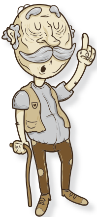
ILLUSTRATION: STEFAN VOELLER